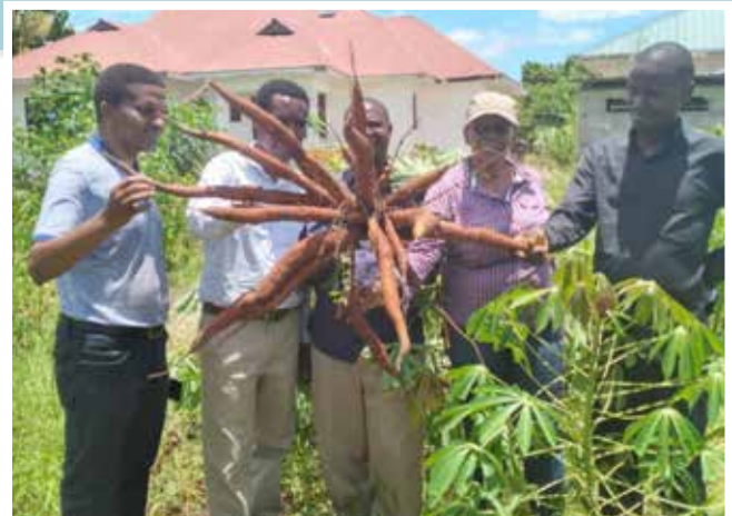
Wajumbe wa kamati ya uchumi ya Usharika wa Kanisa Kuu Azaniafront wakikagua shamba la mihogo lililoko Kiharaka. Kama inayoonekana kwenye picha, zao linakaribia kukomaa.