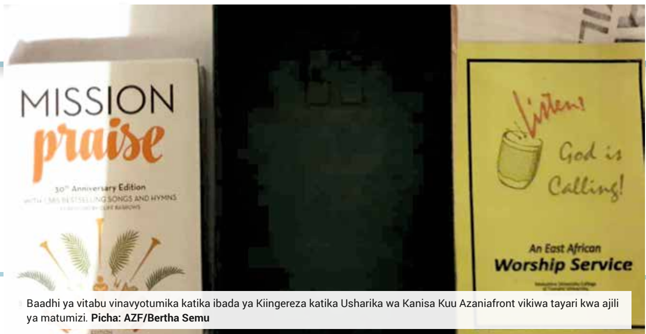
Baadhi ya vitabu vinavyotumika katika ibada ya Kiingereza katika Usharika wa Kanisa Kuu Azaniafront vikiwa tayari kwa ajili ya matumizi.

Kwa maelezo na taarifa kwa kina juu ya ratiba na shughuli zote zinazofanyika usharikani, tembelea ofisi ya parish worker au tovuti rasmi ya usharika www.azaniafront.org .