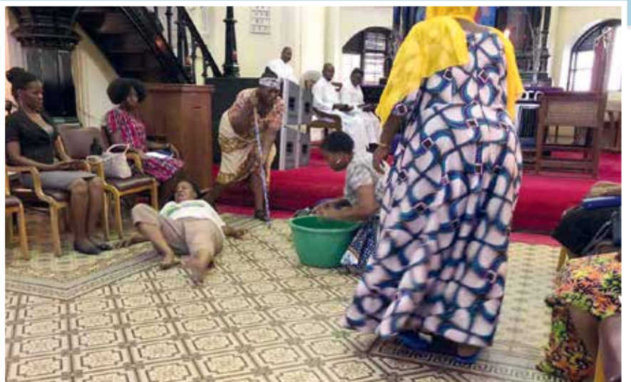
Katika Picha: Wanawake wakisherehesha ibada ya kwaresma kwa kufanya igizo la mateso ya Yesu Kristo ikiwa ni wiki chache kuelekea sikukuu ya Pasaka.