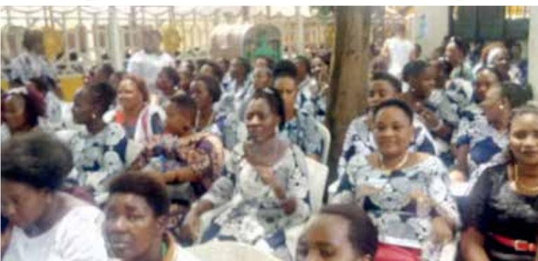
Katika Picha: Sehemu ya wanawake kutoka usharia wa Kanisa Kuu Azaniafront walioshiriki katika maombi ya dunia yaliyofanyika Msimbazi Centre jijini Dar es Salaam.