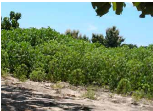
Shamba la mihogo kama linavyoonekana katika eneo la mradi wa Kituo cha Kiroho cha Kiharaka lililopo Bagamoyo moani Pwani.