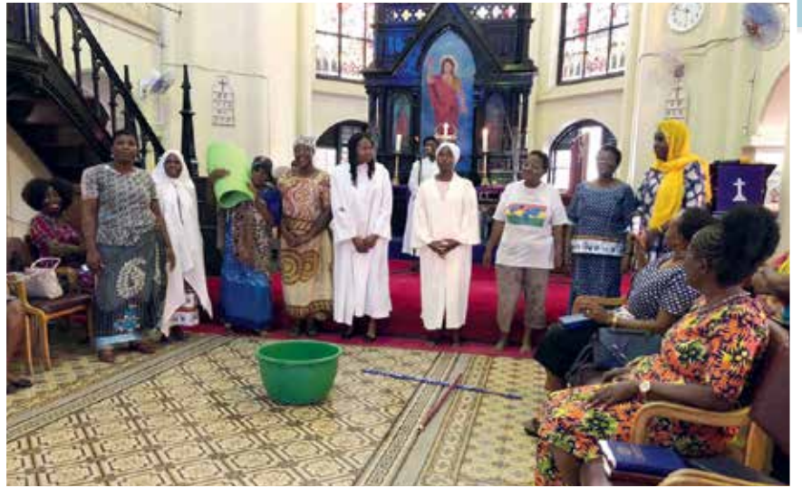
Wanawake wakishiriki katika igizo kwenye ibada ya Kwaresma iliyofanyika Usharikani Azaniafront, Jumatano tarehe 11 Machi 2020.